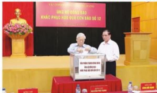
Tổng Bí thư Nguyễn Phú Trọng và nguyên Tổng Bí thư Nông Đức Mạnh tham gia quyên góp ủng hộ đồng bào bị ảnh hưởng lũ lụt