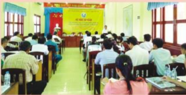
Hội nghị tập huấn "Tiêu chí xã an toàn về phòng chống thiên tai trong xây dựng Nông thôn mới"

Ngày 21/11, Ban chỉ đạo TW về PCTT đã tổ chức hội nghị tập huấn tại huyện huyện Gò Công Đông, tỉnh Tiền Giang. Lớp tập huấn "Tiêu chí xã an toàn về phòng chống thiên tai trong xây dựng Nông thôn mới" tại UBND và "Chương trình tập huấn tuyên truyền Luật Phòng, chống thiên tai" tại xã Tân Thành. Chương trình tập huấn này thuộc Đề tài khoa học "Nghiên cứu, xây dựng tiêu chí an toàn về phòng chống thiên tai trong xây dựng nông thôn mới".