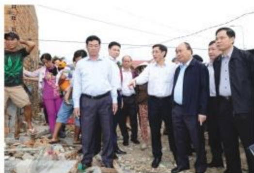
Thủ tướng Chính phủ Nguyễn Xuân Phúc thăm hỏi bà con ven biển bị ảnh hưởng bão số 12

Tỉnh ủy, UBND hai tỉnh cần rút kinh nghiệm sâu sắc trong chỉ đạo phòng chống bão lũ thời gian tới, không được chủ quan, cần có thái độ kiên quyết, tăng cường kiểm tra quyết liệt hơn nữa trong việc di dời, thậm chí thực hiện một số biện pháp cưỡng chế, không để người dân còn ở trên lòng bè, những nơi nguy hiểm khi mà nhiều người