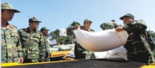
Chiến sĩ Bộ đội Biên phòng Khánh Hòa đưa hàng viện trợ lên xe tải

Trong khuôn khổ hợp tác Hội nghị cấp cao Diễn đàn Hợp tác kinh tế Châu Á - Thái Bình Dương APEC, Chính phủ nước Cộng hòa Liên bang Nga đã xuất hàng cứu trợ khẩn cấp cho người dân bị thiệt hại nặng nề thuộc các tỉnh Khánh Hòa, Phú Yên.