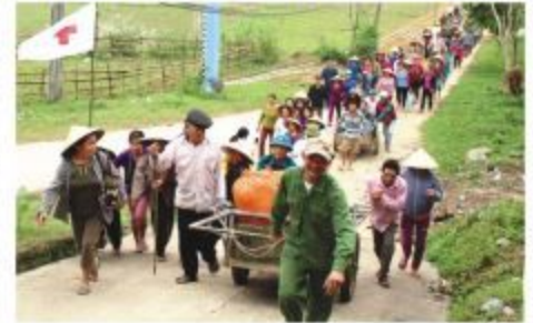
Diễn tập sơ tán khi có bão lũ

Thông qua Dự án "Quản lý rủi ro và ứng phó thiên tai dựa vào cộng đồng tại Quảng Bình" Ban chỉ đạo diễn tập phòng chống thiên tai, tìm kiếm cứu nạn, Hội Chữ thập đỏ tỉnh Quảng Bình phối hợp cùng 02 xã Mai Hóa (12/11), Thuận Hóa (14/11) tổ chức Diễn tập Phòng chống thiên tai và tìm kiếm cứu nạn năm 2017.