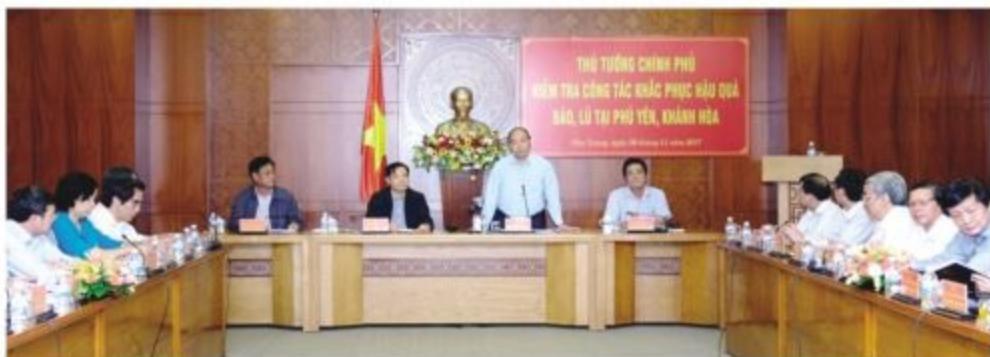
Thủ tướng Chính phủ Nguyễn Xuân Phúc giao nhiệm vụ cho cán bộ hai tỉnh Phú Yên, Khánh Hòa và các bộ, ngành

Thủ tướng quyết định hỗ trợ 1.000 tỷ đồng cho các tỉnh bị thiệt hại do bão lũ, trong đó Phú Yên nhận 170 tỷ đồng và Khánh Hòa 260 tỷ đồng. Đây được coi là mức hỗ trợ cao nhất từ trước tới nay. Đồng thời, Thủ tướng cũng nhất trí hỗ trợ 1.000 tấn gạo cho mỗi tỉnh Khánh Hòa, Phú Yên đưa đến nhân dân kịp thời và yêu cầu 2 tỉnh Phú Yên - Khánh Hòa từ nay đến Tết Nguyên đán không được để người dân thiếu đói, cần sớm hỗ trợ người dân khắc phục nhà cửa sau bão số 12.