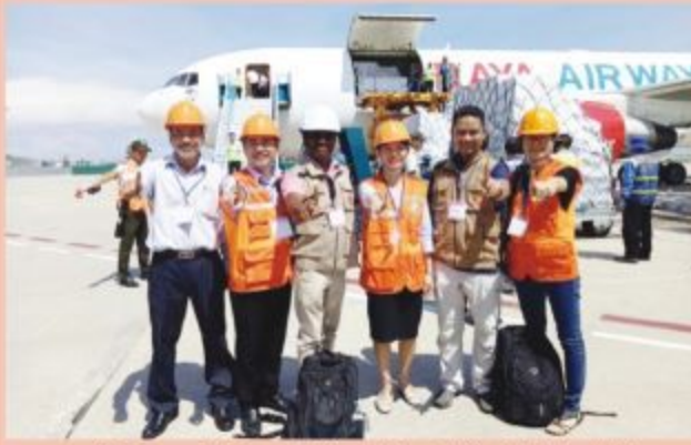
Tổng cục Phòng, chống thiên tai và đại diện AHA giao nhận hàng cứu trợ