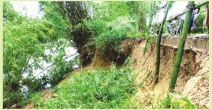
Sạt lở đất bờ sông Hiếu ăn sâu vào đường giao thông ở thôn Định Xá, xã Cam Hiếu, huyện Cam Lộ (Quảng Trị).

Phó Ban Chỉ huy Phòng chống thiên tai và Tìm kiếm cứu nạn huyện Hải Lăng - ông Dương Việt Hải cho biết: "Sạt lở bờ sông khiến nhiều tuyến đường giao thông và nhiều diện tích đất hoa màu ven sông bị nước cuốn trôi, người dân đang đứng trước nguy cơ bị mất đường đi, mất đất sản xuất dần dần qua các mùa mưa lũ. Đồng