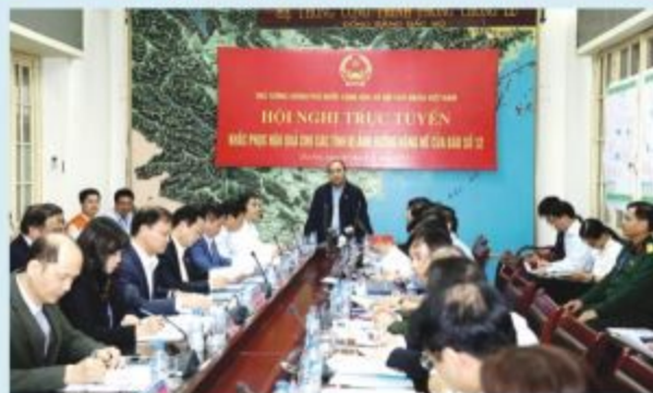
Thủ tướng Chính phủ Nguyễn Xuân Phúc chủ trì hội nghị

Thủ tướng yêu cầu chính quyền các cấp, hệ thống chính trị tiếp tục chỉ đạo đồng bộ, quyết liệt để nhân dân không bị đói, không làm vào cảnh "màn trời chiếu đất", triển khai ngay việc hỗ trợ lương thực và thuốc men cho người dân, tiếp tục tìm kiếm các nạn nhân còn mất tích; lực lượng Quân khu 5 dừng việc huấn luyện để tập trung khắc phục giúp nhân dân; Bộ Tài nguyên và Môi trường chủ trì phối hợp với các bộ, ngành liên quan và các địa phương thực hiện việc quy hoạch lại dân cư đối với các vùng bị sạt lở đất đồng thời chỉ đạo Trung tâm Khí tượng Thủy văn Quốc gia, Trung tâm Dự báo Khí tượng Thủy văn Trung ương thường xuyên cung cấp bản tin dự báo, cảnh báo thiên tai sát với thực tế để các địa phương chủ động, kịp thời ứng phó với bão, mưa lũ; Bộ Giao